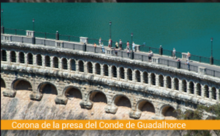
Corona de la presa del Conde de Guadalhorce

Estos hitos son el Paraje Natural del Desfiladero de los Gaitanes, las Presas de El Chorro/Conde de Guadalhorce y Gaitanejo, las pasarelas del Salto hidroeléctrico de El Chorro, la estación de ferrocarriles de El Chorro y puentes sobre los Gaitanes así como la Cueva paleolítica de Ardales, la Necrópolis prehistórica de las Aguilillas y la Iglesia rupestre mozárabe de Bobastro.