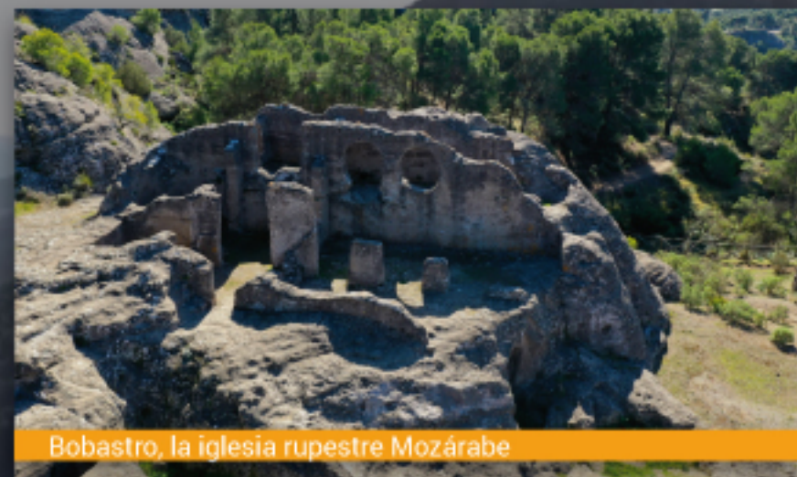
Bobastro, la iglesia rupestre Mozárabe

Para incorporar nuestra candidatura a la Lista Indicativa del Gobierno de España es fundamental justificar el Valor Universal Excepcional de cada uno de los hitos. Y, convencidos de que cada una de ellas lo posee, son los 7 motivos que nos llevan a solicitar vuestra adhesión a esta petición.