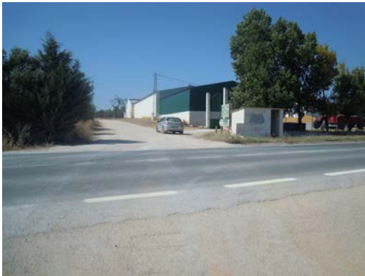
WPT5. Cruce con la carretera MA-4100