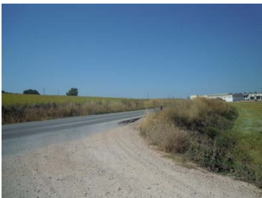
WPT7. Inicio de coincidencia con carretera A-7203