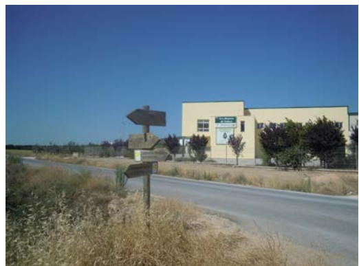
WPT8. Fin de coincidencia con carretera A-7203