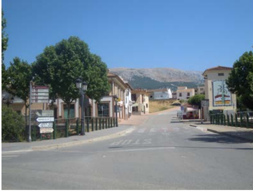
WPT1. Inicio de etapa y de coincidencia con PR-A 339