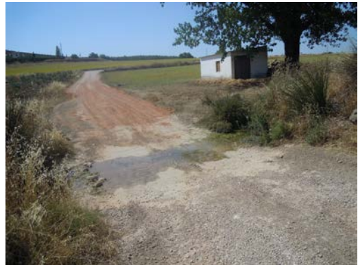
WPT6. Arroyo de la Vivarena