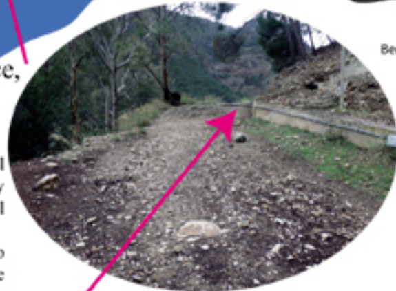
Principio del Sendero

Pasado el camping, dejamos arriba a la derecha la Ermita del Chorro y, poco después, llegamos a un puente de piedra conocido como Puente de la Josefona, donde aparcamos.