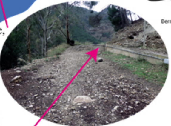
Principio del Sendero

El acceso desde Álara a El Chorro se realiza por la Avda de Pablo Ruiz Picasso para llegar a la carretera de Ardales, donde a unos 10 km, a la derecha por encima de la presa, encontramos el cruce dirección a El Chorro y la estación del tren, seguimos las indicaciones de la Subestación de la Encantada. Pasado el camping, dejamos arriba a la derecha la Ermita del Chorro y, poco después, llegamos a un puente de piedra conocido como Puente de la Josefona, donde aparcamos.