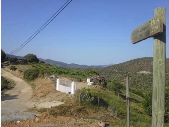
WPT1. Inicio de Sendero