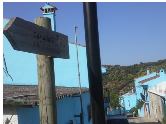
WPT6. Fin de Sendero