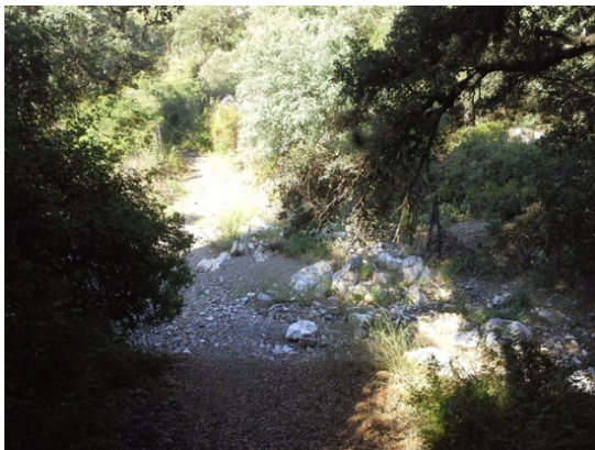
WPT3. Arroyo Blanco