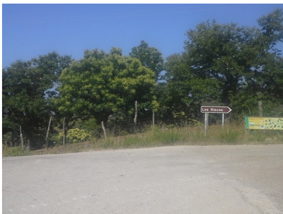
WPT5. Fin de coincidencia con carretera MA-7303