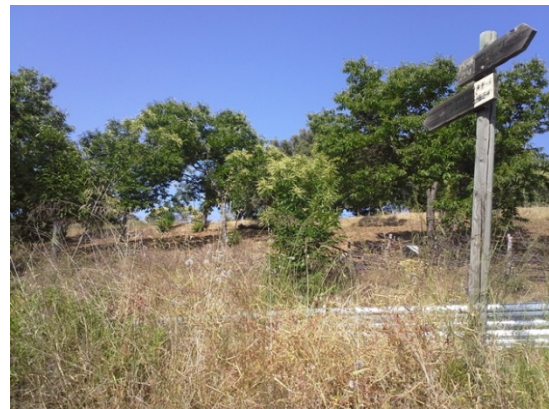
WPT4. Coincidencia Carretera MA-7303