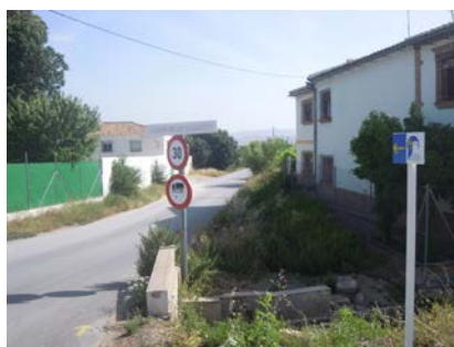
WPT5. Fin de etapa