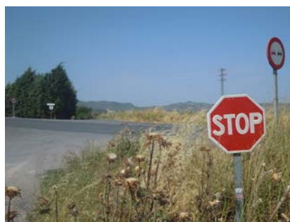
WPT4. Cruce carretera