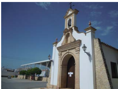
WPT1. Inicio etapa