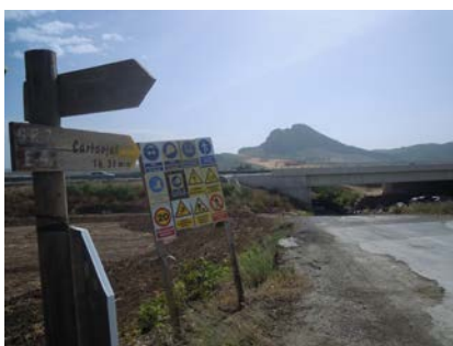
WPT3. Cruce carretera