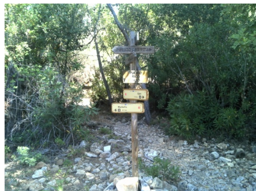
WPT6. Inicio de coincidencia con PR-A 169