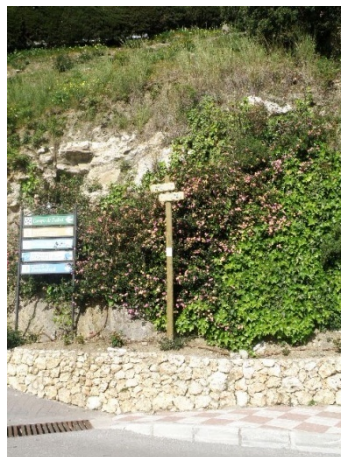
WPT9. Fin de etapa y de coincidencia con GR 249 Etapa 31