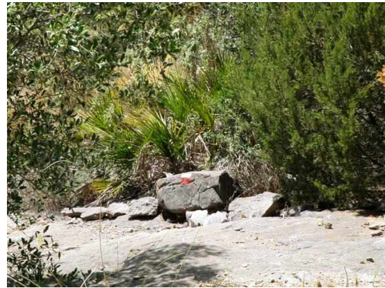
WPT4. Cruce del arroyo las Piedras