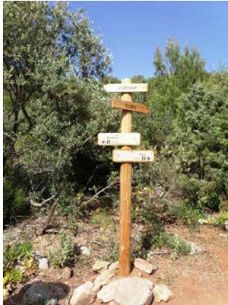
WPT7. Fin de coincidencia con PR-A 169