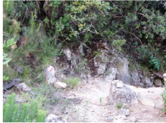
WPT8. Cruce del arroyo del Tajo