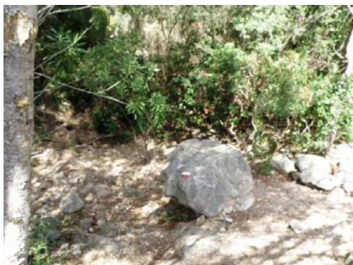
WPT5. Cruce del arroyo Guadalpín