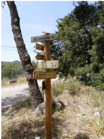
WPT3. Fin de coincidencia con PR-A 140