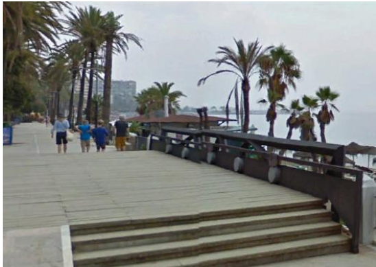
WPT1. Inicio de etapa y de coincidencia con GR 249 Etapa 31