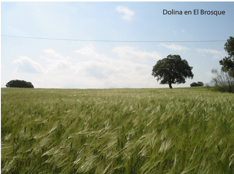
Dolina en El Brosque

Antigua fuente de la localidad de Archidona destinada a abreviar el ganado, donde actualmente se han realizado diversas actuaciones de recuperación como zona de esparcimiento y ocio de la ciudadanía aprovechando su proximidad al pueblo.