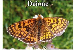
Mélitée des linaires