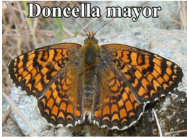
Mélitée des centaures

Mélitée des centaures : il est plus grand et, ouvert, la forme de filet est très bien définie et ses taches orange peeu étirées. Mélitée andalouse : il est de plus grande taille. Ouvert, les taches sombres de la femelle sont plus grandes, en particulier celle qui traverse le milieu de l'aile antérieure. Mélitée des linaires : fermé, il est difficile de les discerner, mais son blanc est généralement plus pur, surtout sur les bandes qui traversent le milieu de l'aile. Ouvert, la différence principale est la tache située au milieu du bord interne de l'aile antérieure, qui n'est pas oblique mais perpendiculaire et souvent très grande, car elle est peut être unie à celle du dessus. Le orange semble moins présent que chez la Mélitée des scabieuses car tous les motifs marron sont plus larges, aussi bien celui du milieu de l'aile antérieure que celui du milieu de l'aile postérieure qui, chez la Mélitée des scabieuses, est une simple trace ou n'existe pas.