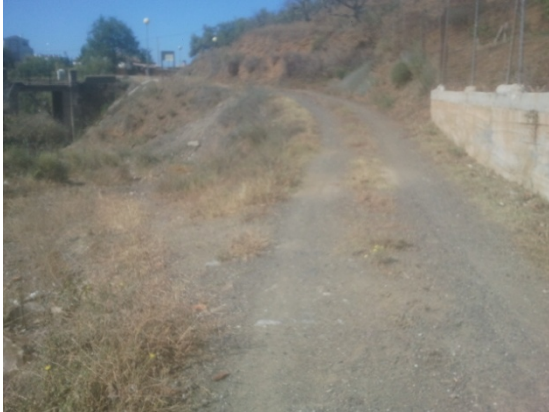
WPT1. Inicio de sendero