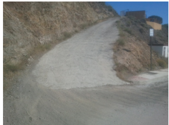
WPT4. Fin de sendero y de coincidencia con SL-A 83