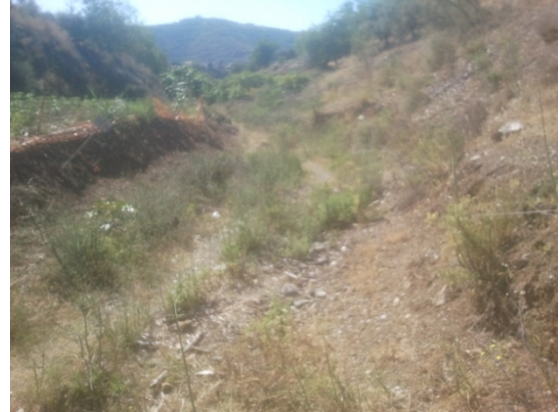
WPT2. Inicio de arroyo