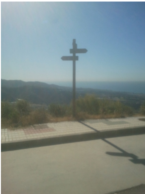
WPT3. Inicio de coincidencia con SL-A 83