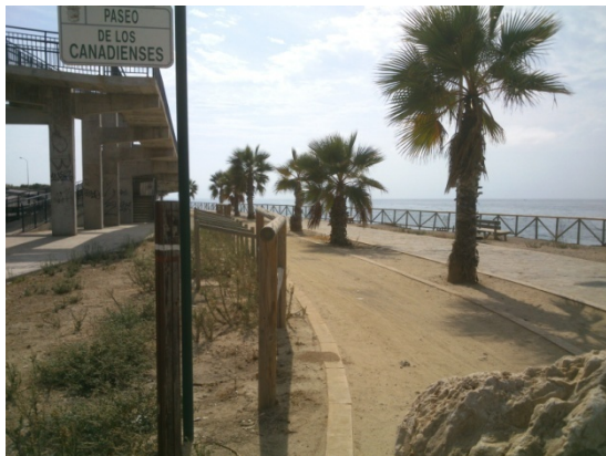
WPT3. Fin de tramo común carretera