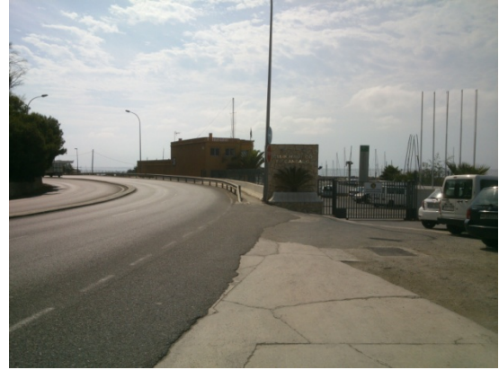
WPT2. Inicio carretera