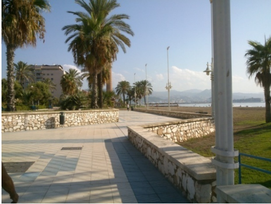
WPT1. Inicio de etapa y de coincidencia con GR 249 Etapa 1