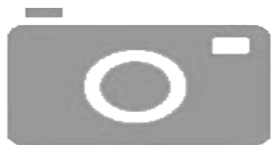
Imagen no disponible