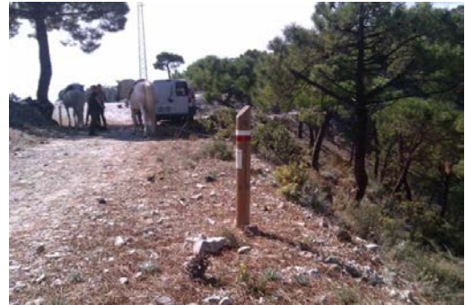
WPT2. Inicio de coincidencia con el sendero Casa de La Mina – Los Pradillos