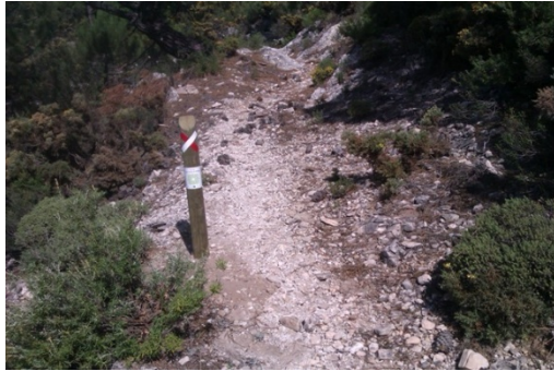
WPT7. Fin de coincidencia 2 con el sendero Fábrica de la Luz – Puerto de Cómpea