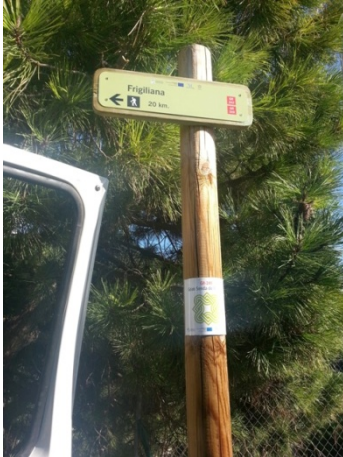
WPT1. Inicio de etapa y de coincidencia con GR 249 Etapa 6