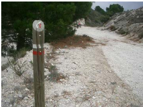
WPT3. Inicio de coincidencia con el sendero Fábrica de la Luz – Puerto de Cómpeeta