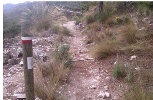
WPT4. Fin de coincidencia con el sendero Casa de la Mina – Los Pradillos