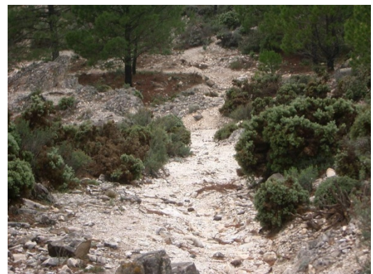
WPT6. Inicio de coincidencia 2 con Fábrica de la Luz – Puerto de Cómpeeta