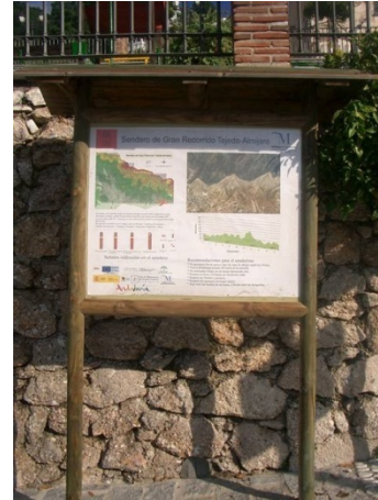
WPT8. Fin de etapa y de coincidencia con GR 249 Etapa 6