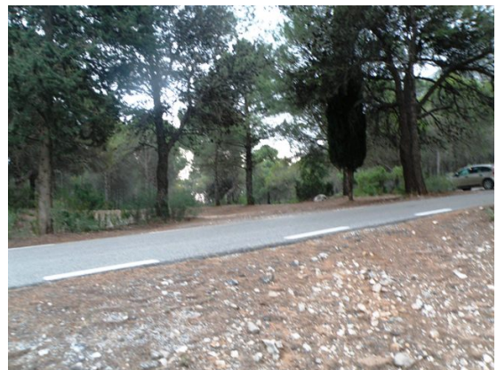
WPT4. Inicio de coincidencia con carretera