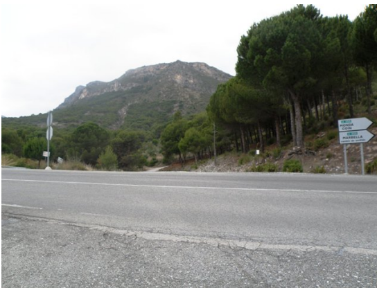
WPT3. Cruce de carretera