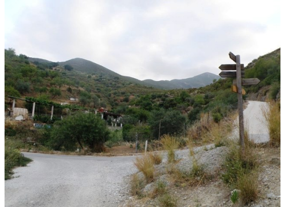
WPT2. Fin de coincidencia con GR 243 Etapa 6