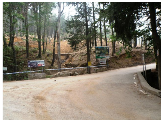
WPT6. Fin de coincidencia con carretera y con PR-A 278