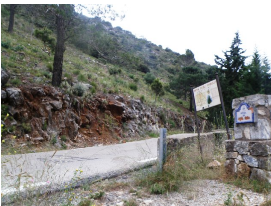
WPT5. Inicio de coincidencia con el PR-A 278