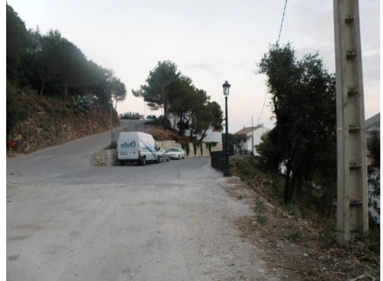
WPT8. Fin de etapa y de coincidencia con GR 243 Etapa 8 y PR-A 167