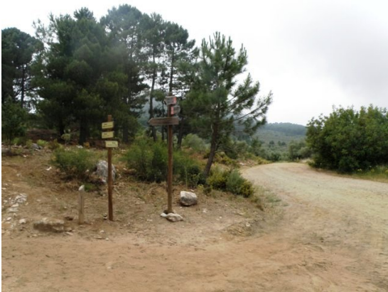
WPT7. Inicio de coincidencia con GR 243 Etapa 8 y PR-A 167