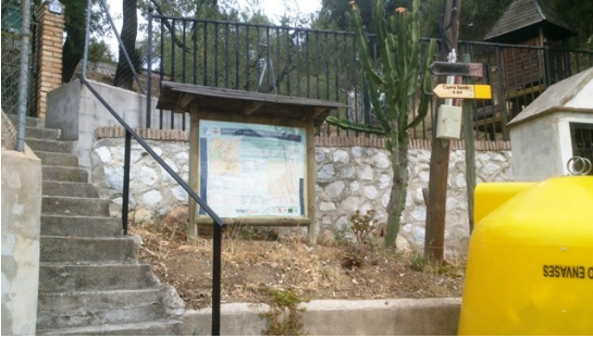
WPT1. Inicio de etapa y de coincidencia con GR 243 Etapa 6