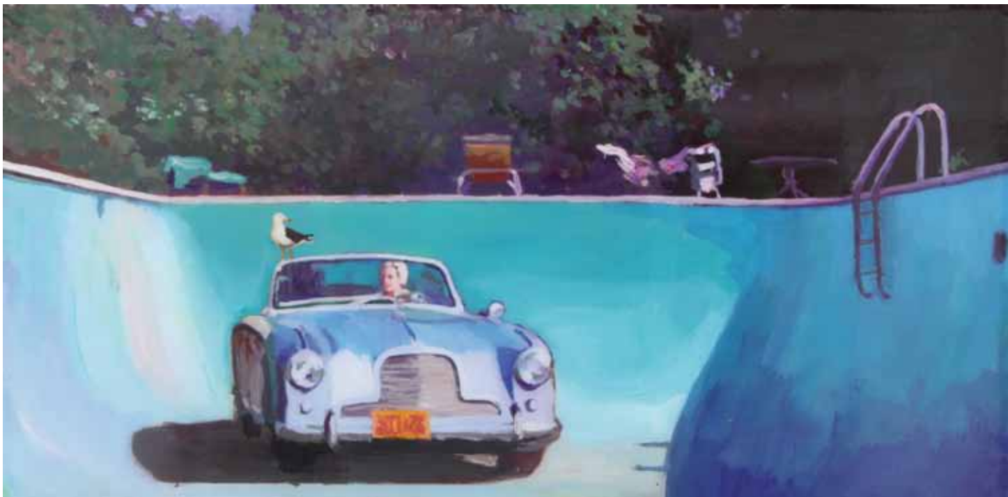
THE BIRD Acrílico y resina sobre tabla 30 x 60 cm 2016