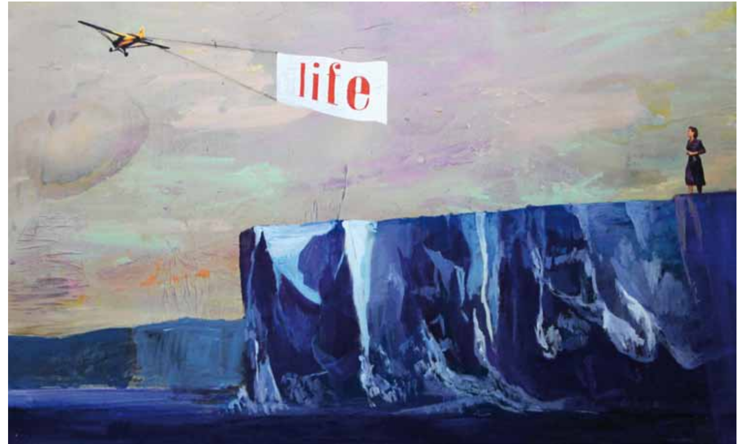
FIN Acrílico y resina sobre tabla 122 x 190 cm 2016