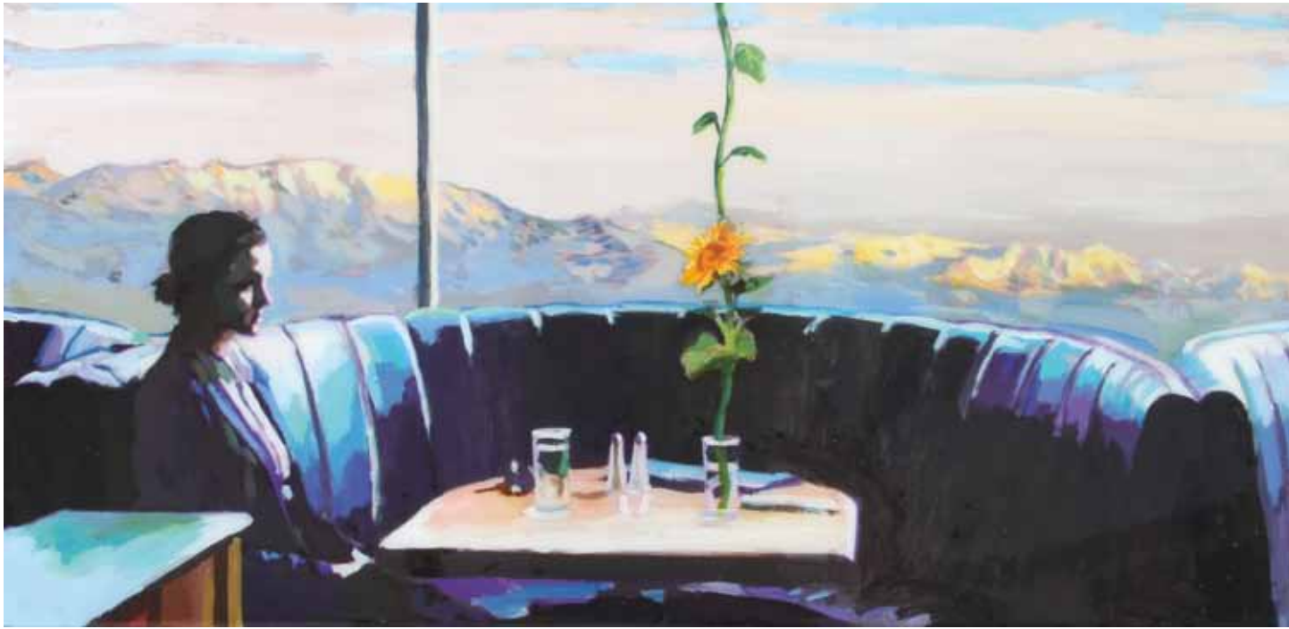
PERSONALITY Acrílico y resina sobre tabla 30 x 60 cm 2016