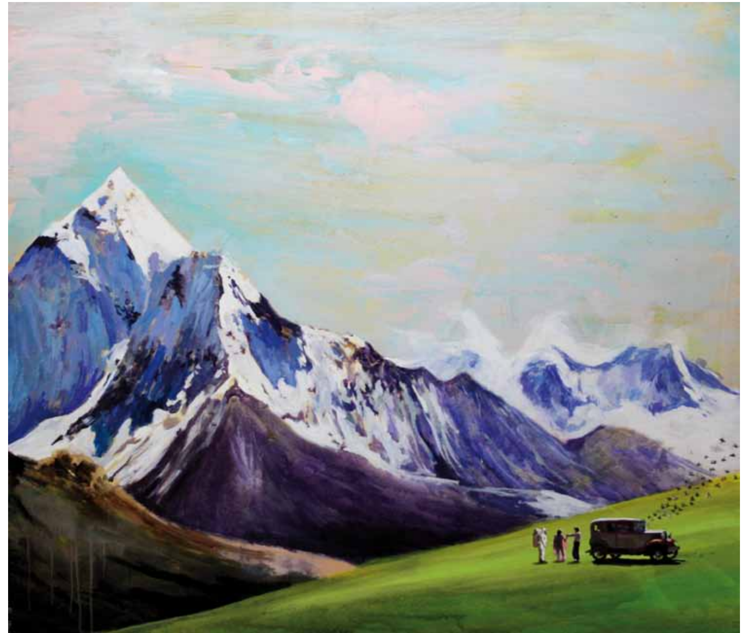
LET'S STICK TOGETHER Acrílico y resina sobre tabla 122 x 140 cm 2015