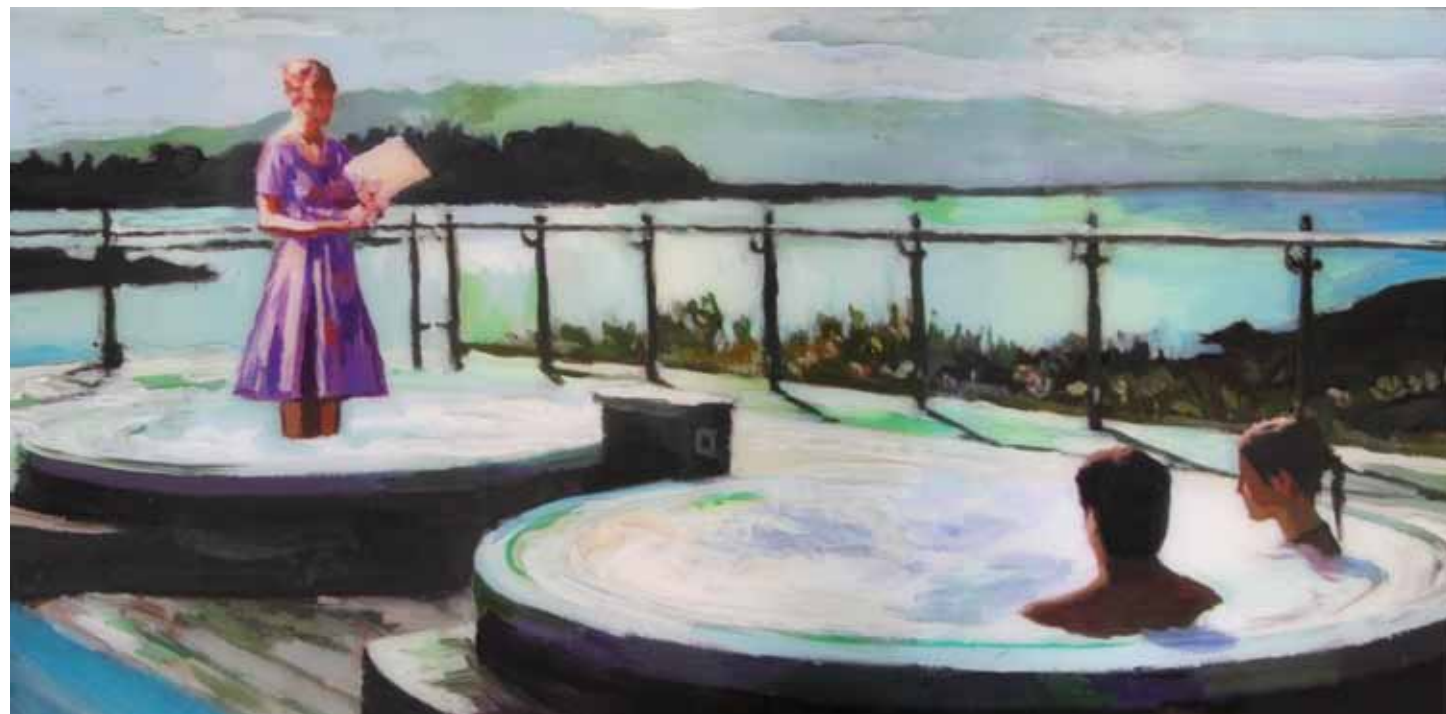
MENÚ PARA INMÓVILES Acrílico y resina sobre tabla 30 x 60 cm 2016