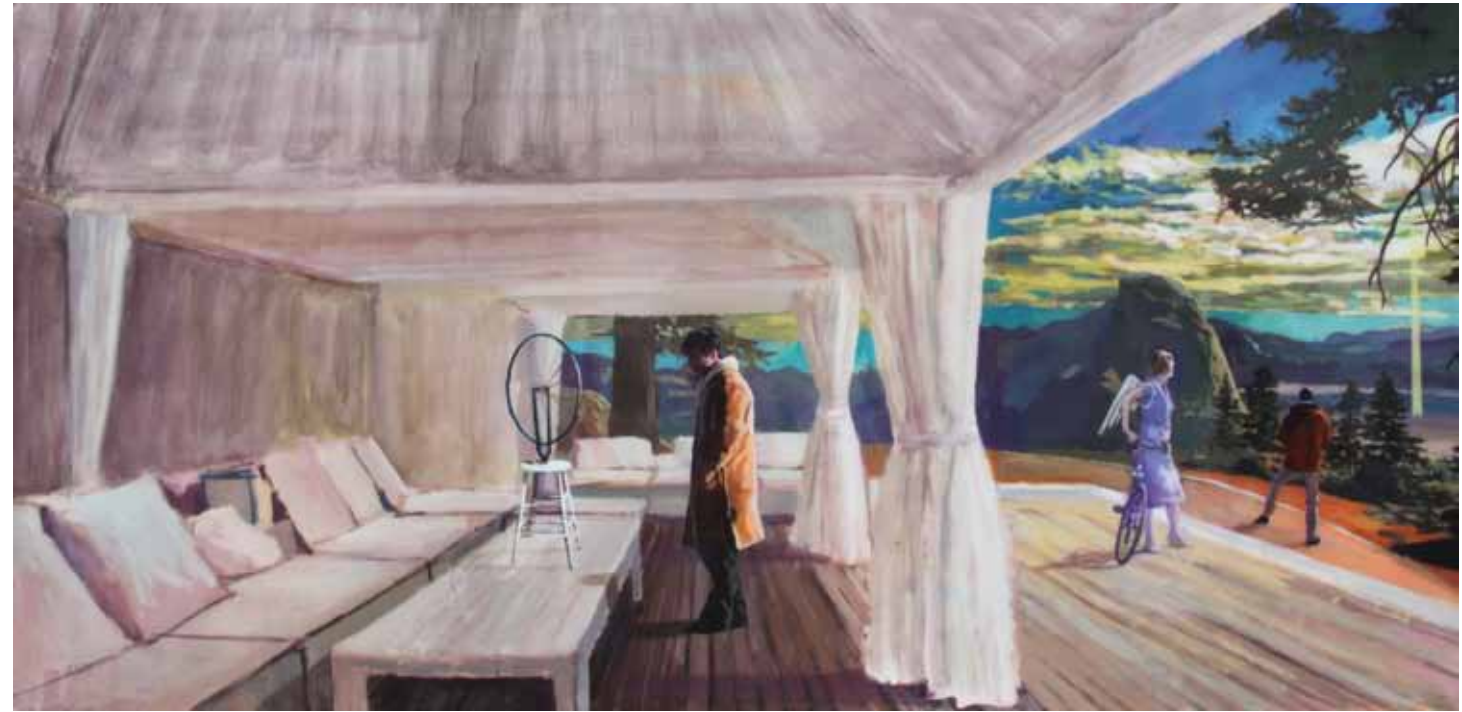
LOS CREADORES Acrílico y resina sobre tabla 60 x 122 cm 2017