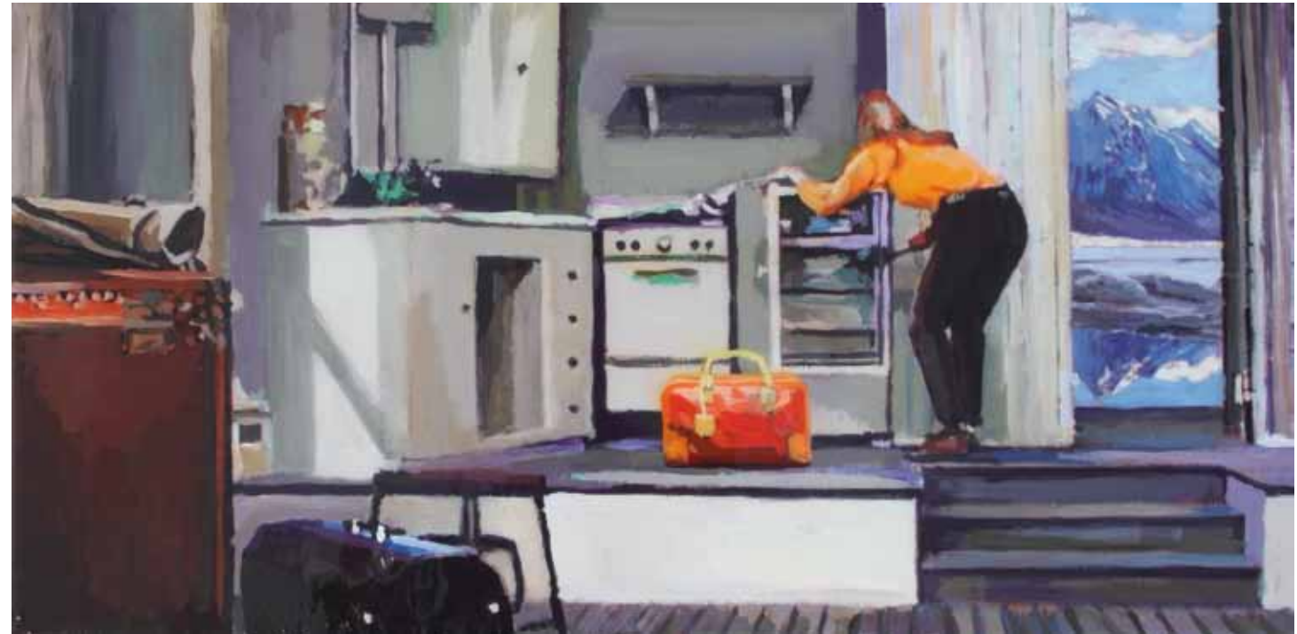
THE GETAWAY Acrílico y resina sobre tabla 30 x 60 cm 2016