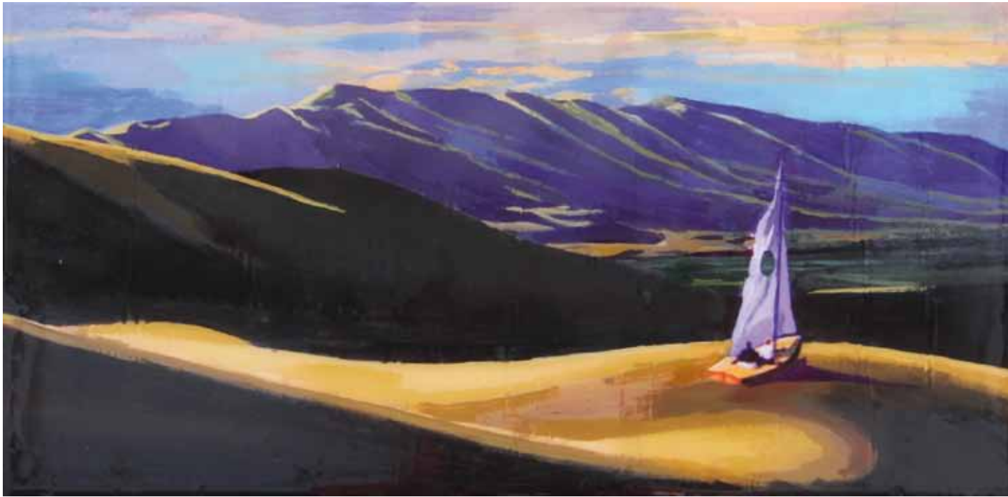
TRAVESÍA (II) Acrílico y resina sobre tabla 30 x 60 cm 2015