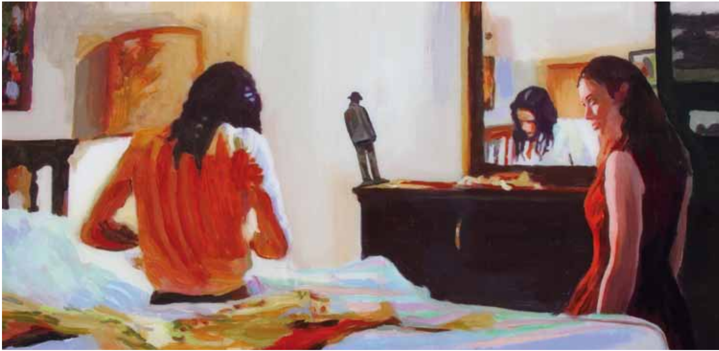
DESEO Acrílico y resina sobre tabla 30 x 60 cm 2016