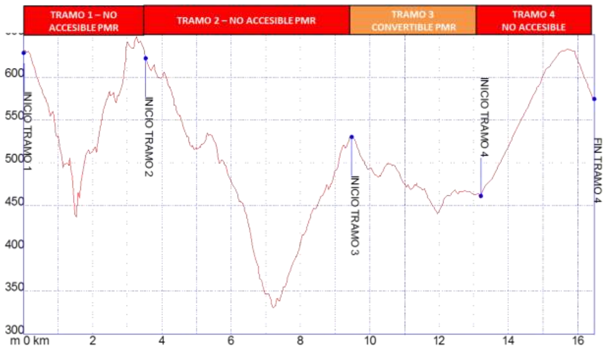
Gráfica 1: Identificación tramos etapa8, nivel de accesibilidad.

➤ PERFIL ETAPA8: Perfil de altitud e identificación por tramos.