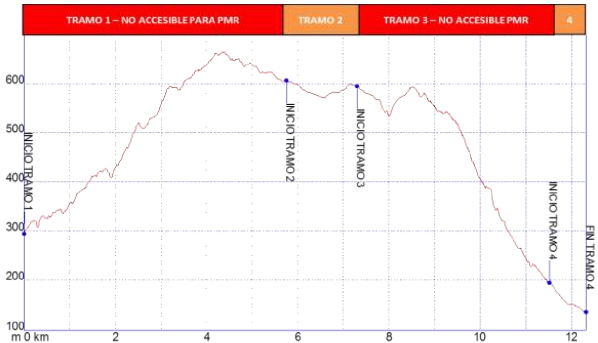
Gráfica 1: Identificación tramos etapa34, nivel de accesibilidad.

➤ PERFIL ETAPA34: Perfil de altitud e identificación por tramos.