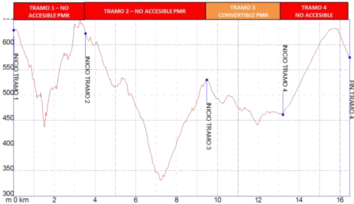
Gráfica 1: Identificación tramos etapa8, nivel de accesibilidad.

➤ PERFIL ETAPA8: Perfil de altitud e identificación por tramos.