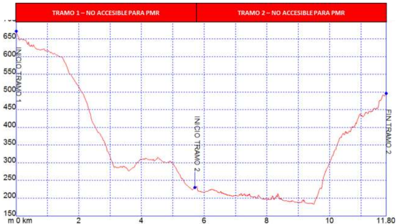
Gráfica I: Identificación tramos etapa27, nivel de accesibilidad.

➤ PERFIL ETAPA 27: Perfil de altitud e identificación por tramos.