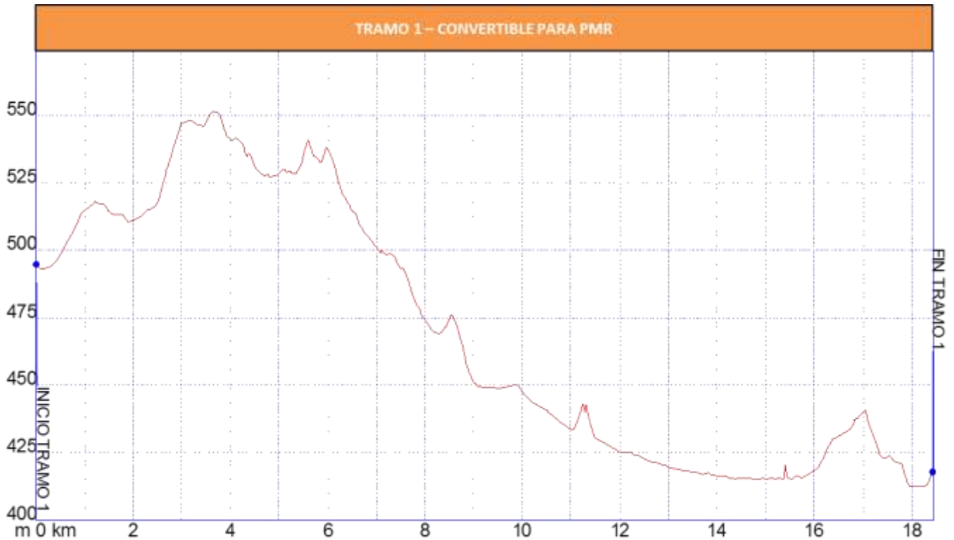
Gráfica 1: Identificación tramos etapa17, nivel de accesibilidad.

Los tramos que se han identificado en la etapa 17 Alameda – Fuente De Piedra para personas con movilidad reducida son los siguientes: