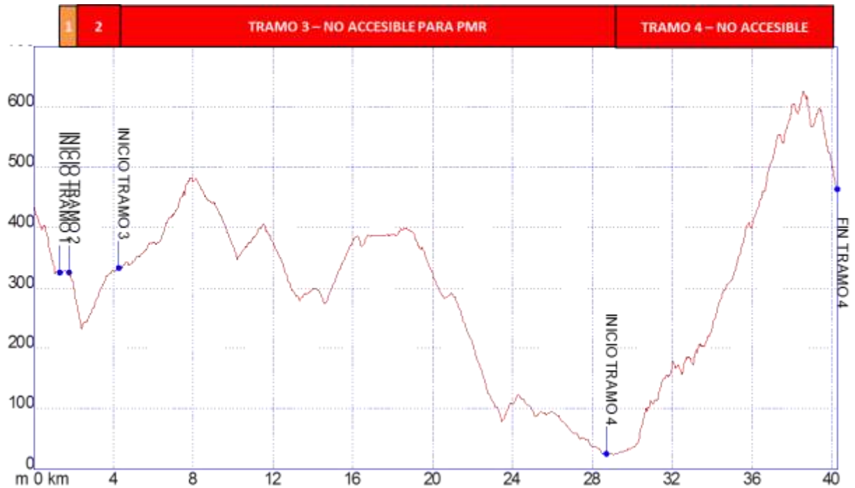
Gráfica I: Identificación tramos etapa32, nivel de accesibilidad.