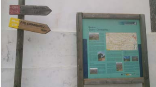
WPT1. Inicio de etapa y de coincidencia con PR-A 279. Enlace con GR 243 Etapa 4