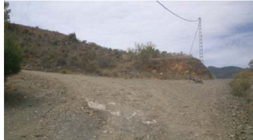
WPT2. Enlace con bifurcación del PR-A 279