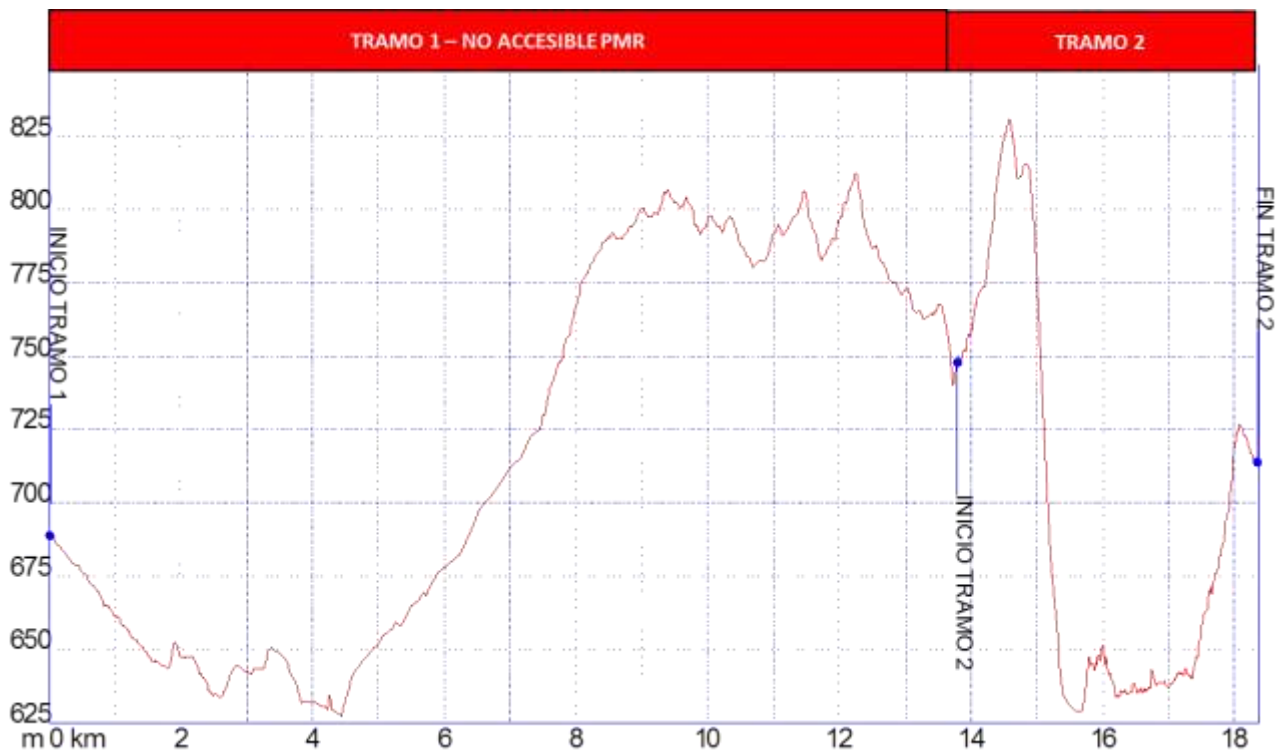
Gráfica I: Identificación tramos etapa12, nivel de accesibilidad.

➤ PERFIL ETAPA12: Perfil de altitud e identificación por tramos.