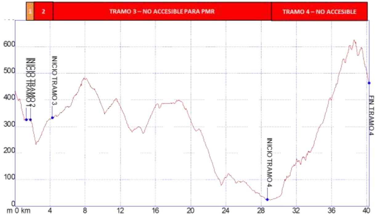
Gráfica 1: Identificación tramos etapa32, nivel de accesibilidad.

Los tramos que se han identificado en la etapa 32 Ojén – Mijas para personas con movilidad reducida son los siguientes: