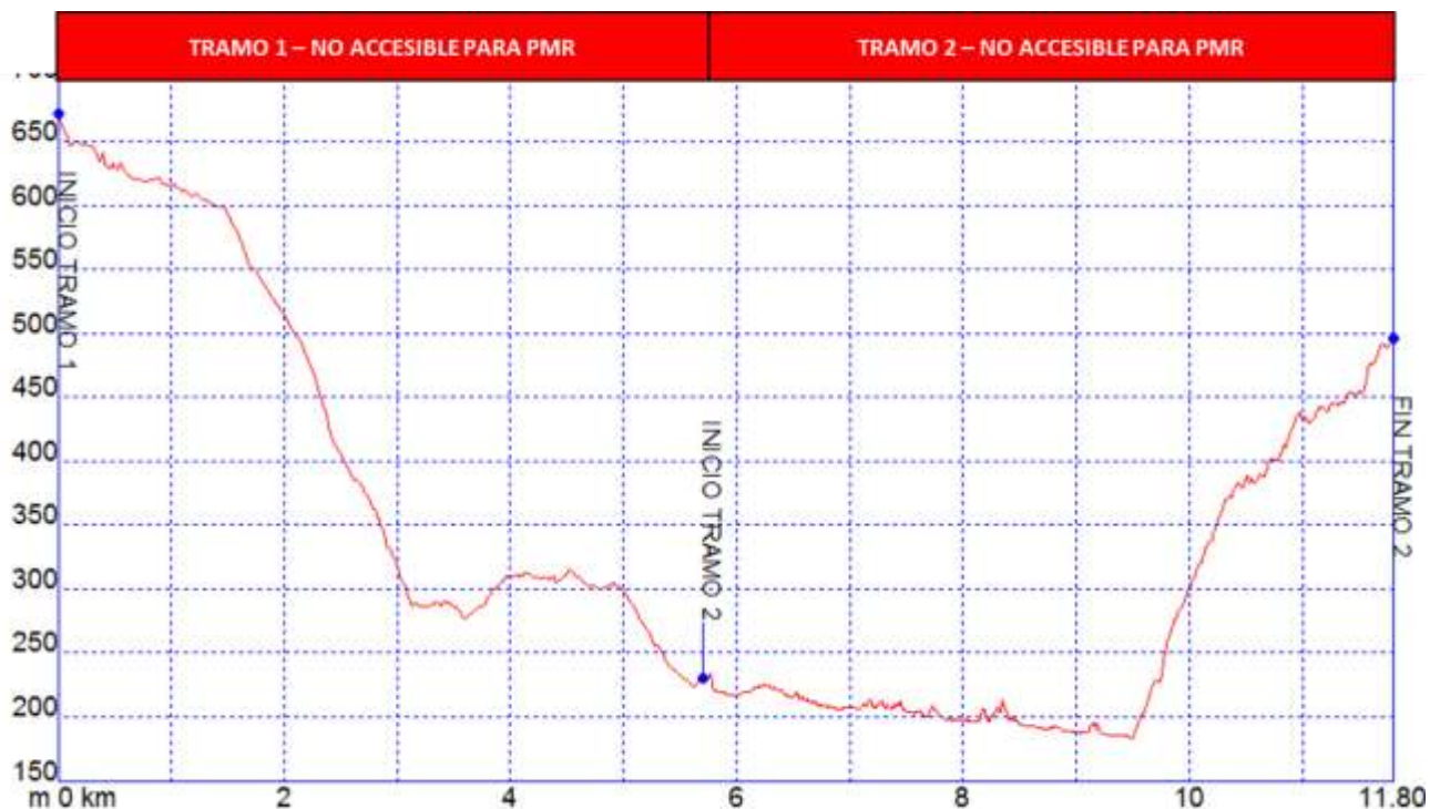
Gráfica 1: Identificación tramos etapa27, nivel de accesibilidad.

➤ PERFIL ETAPA 27: Perfil de altitud e identificación por tramos.