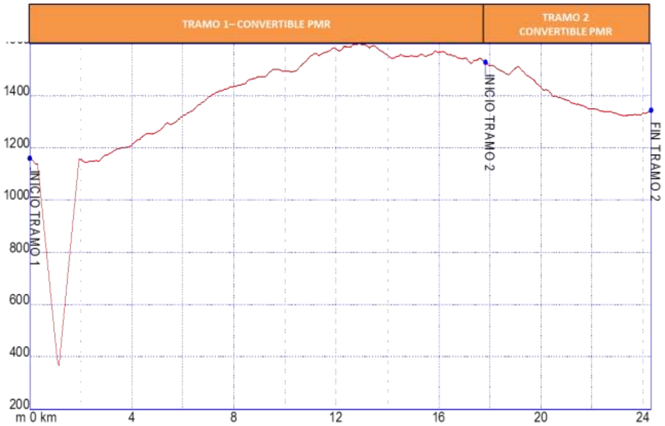
Gráfica I: Identificación tramos etapa22, nivel de accesibilidad.

➤ PERFIL ETAPA 22: Perfil de altitud e identificación por tramos.