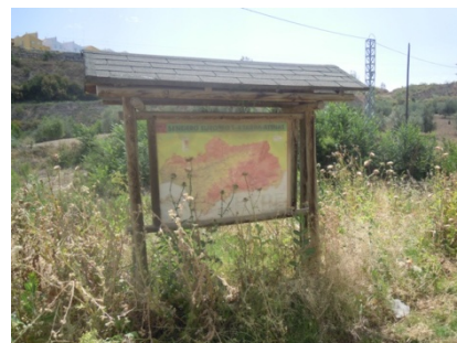
WPT6. Fin de etapa y de coincidencia con GR 249 Etapa 16. Enlace con GR 249 Etapa 15.