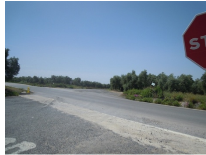
WPT2. Cruce de carretera