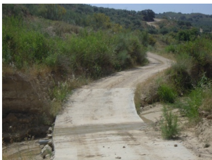
WPT5. Cruce de arroyo