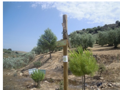
WPT4. Inicio de coincidencia con GR 249 Etapa 16