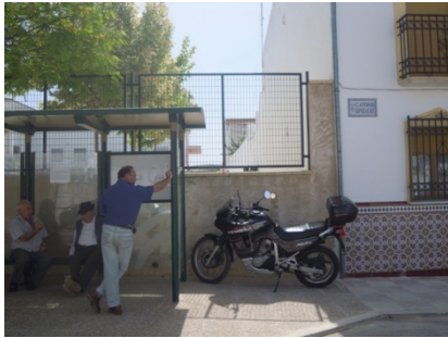
WPT1. Inicio de etapa