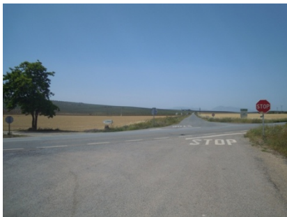
WPT3. Cruce de carretera