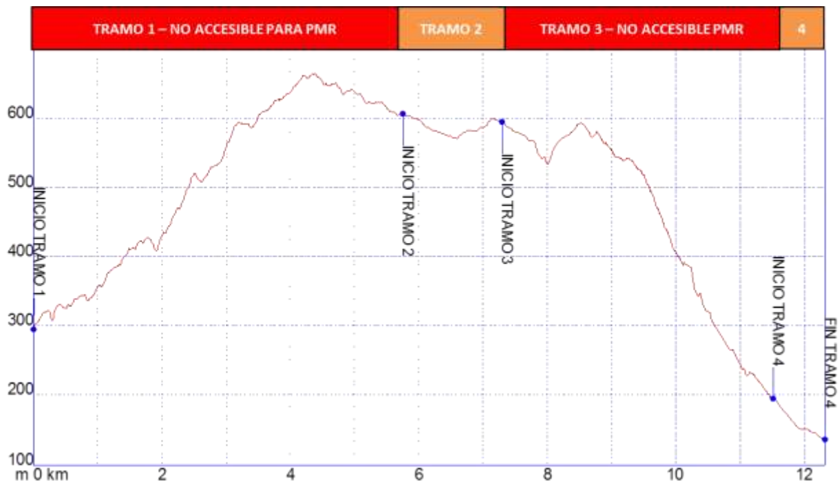
Gráfica 1: Identificación tramos etapa34, nivel de accesibilidad.

➤ PERFIL ETAPA34: Perfil de altitud e identificación por tramos.