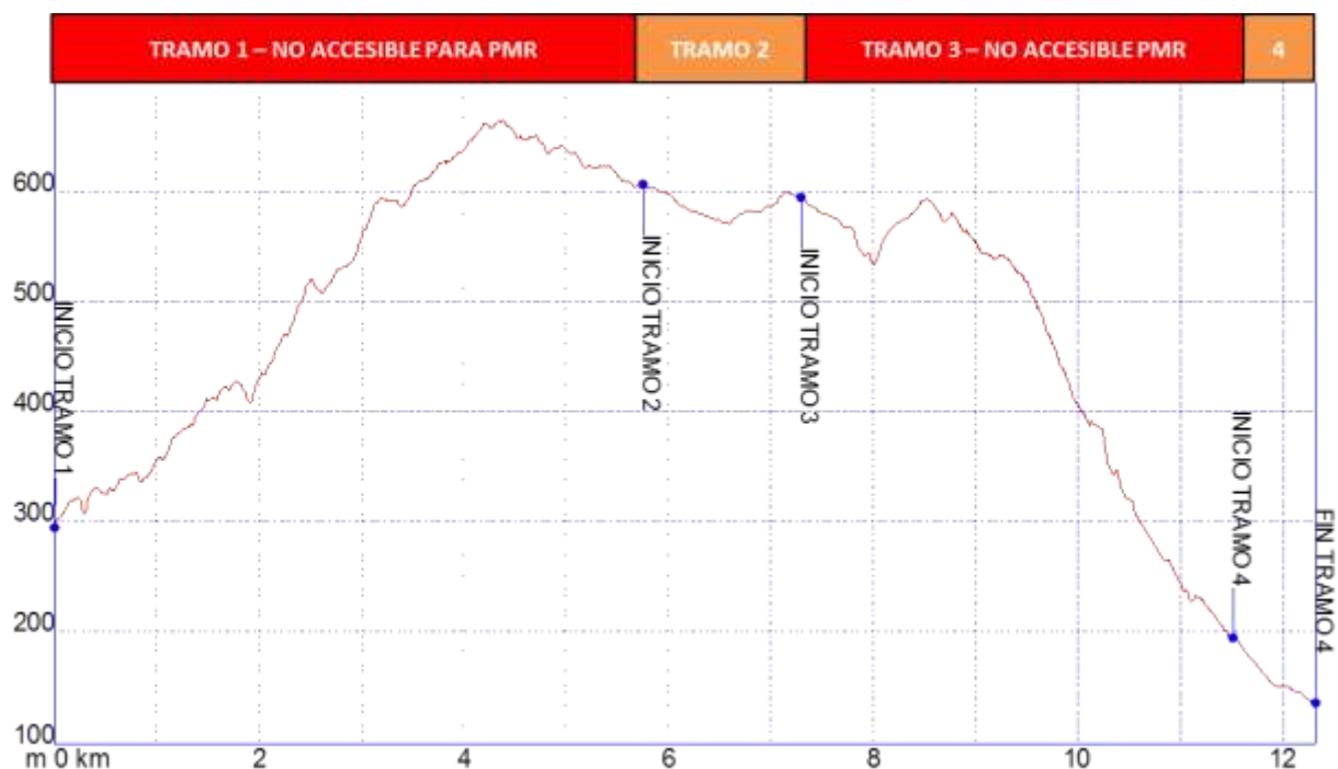
Gráfica 1: Identificación tramos etapa34, nivel de accesibilidad.

➤ PERFIL ETAPA34: Perfil de altitud e identificación por tramos.