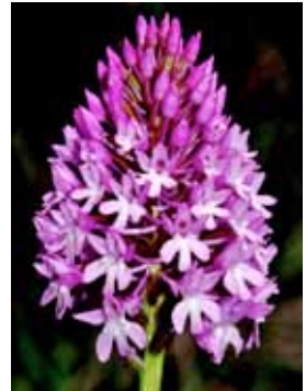
Anacamptis pyramidalis JRL