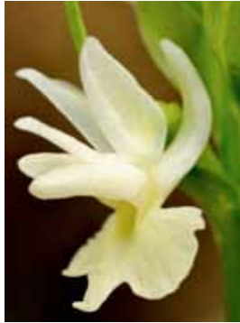
Dactylorhiza sulphurea PM