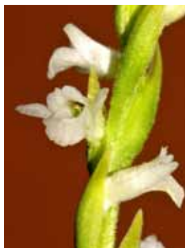
Spiranthes aestivalis JRL