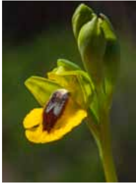
Ophrys lutea JV