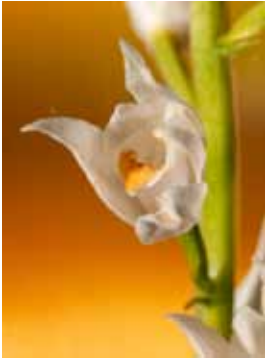
Cephalanthera longifolia JV