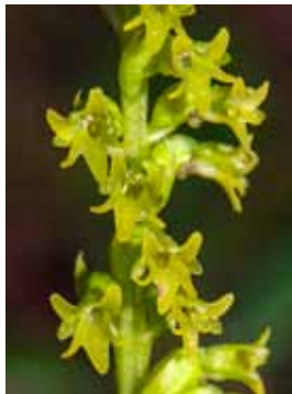
Gennaria diphylla JV