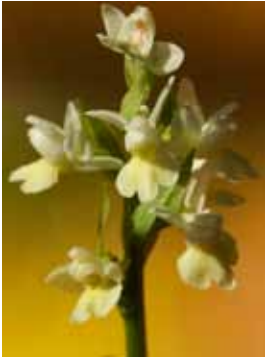
Dactylorhiza insularis JV