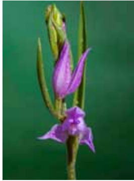
Cephalanthera rubra JV