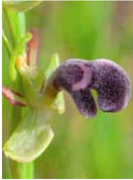
Ophrys dyris JV