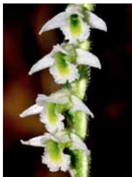
Spiranthes spiralis JRL