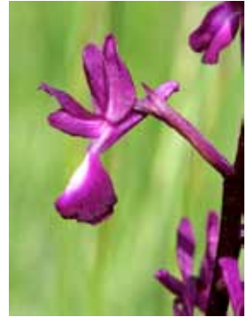
Anacamptis laxiflora JRL