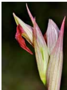
Serapias parviflora JRL