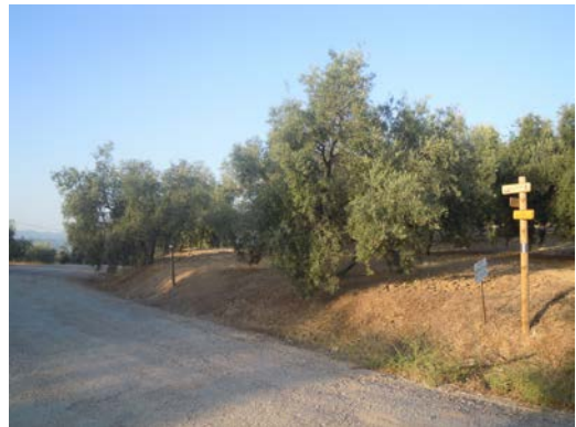
WPT4. Inicio de coincidencia con carril con tráfico rodado