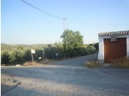
WPT7. Cruce con carretera MA-5100