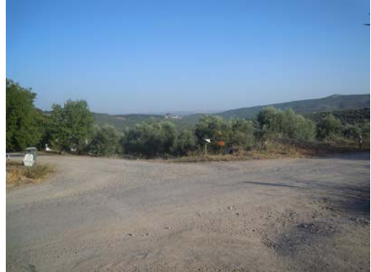
WPT8. Fin de coincidencia con GR 249 Etapa 14