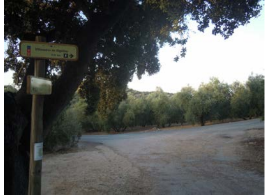
WPT2. Inicio de coincidencia con MA-5100