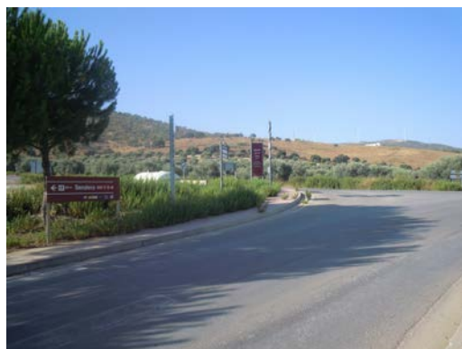
WPT11. Fin de etapa y de coincidencia con PR-A 129