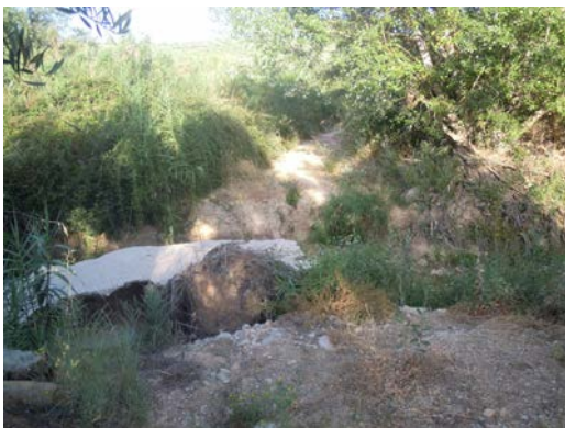
WPT9. Arroyo del Bebedero 2 en mal estado. Imposible continuar