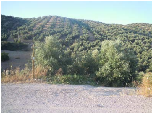
WPT5. Fin de coincidencia con carril con tráfico rodado