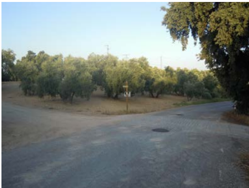
WPT3. Fin de coincidencia con carretera MA-5100