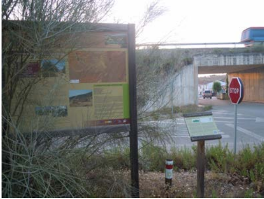
WPT1. Inicio de etapa y de coincidencia con GR 249 Etapa 14. Enlace con GR 249 Etapa 13