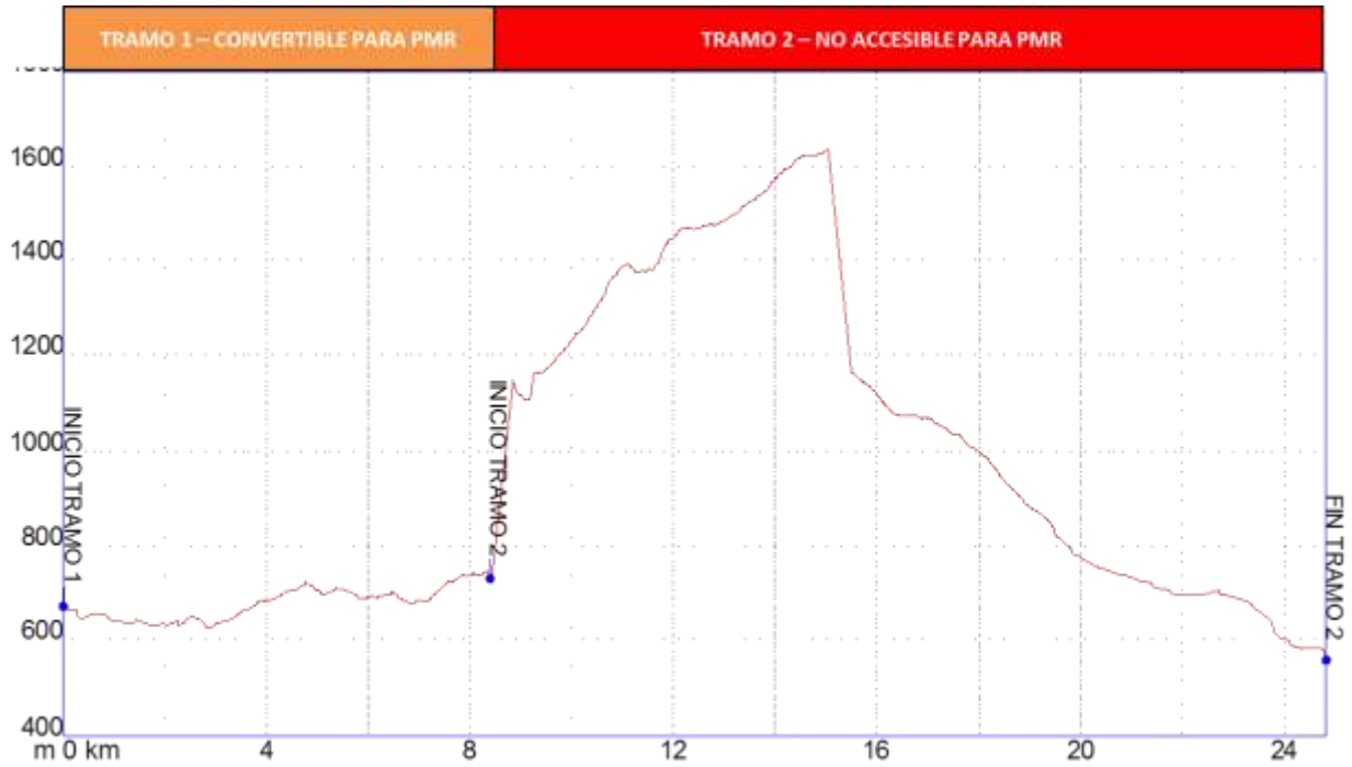
Gráfica 1: Identificación tramos etapa23, nivel de accesibilidad.

➤ PERFIL ETAPA23: Perfil de altitud e identificación por tramos.