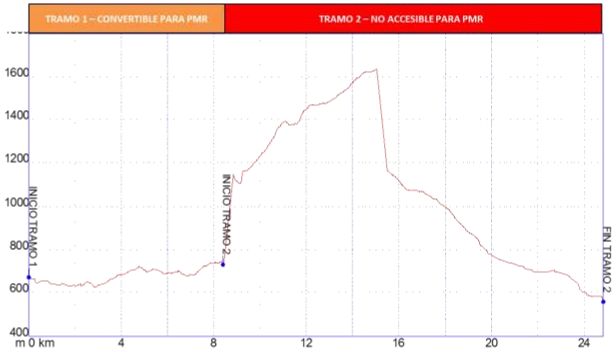
Gráfica 1: Identificación tramos etapa23, nivel de accesibilidad.

➤ PERFIL ETAPA23: Perfil de altitud e identificación por tramos.