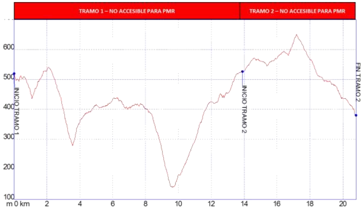
Gráfica 1: Identificación tramos etapa28, nivel de accesibilidad.

➤ PERFIL ETAPA 28: Perfil de altitud e identificación por tramos.