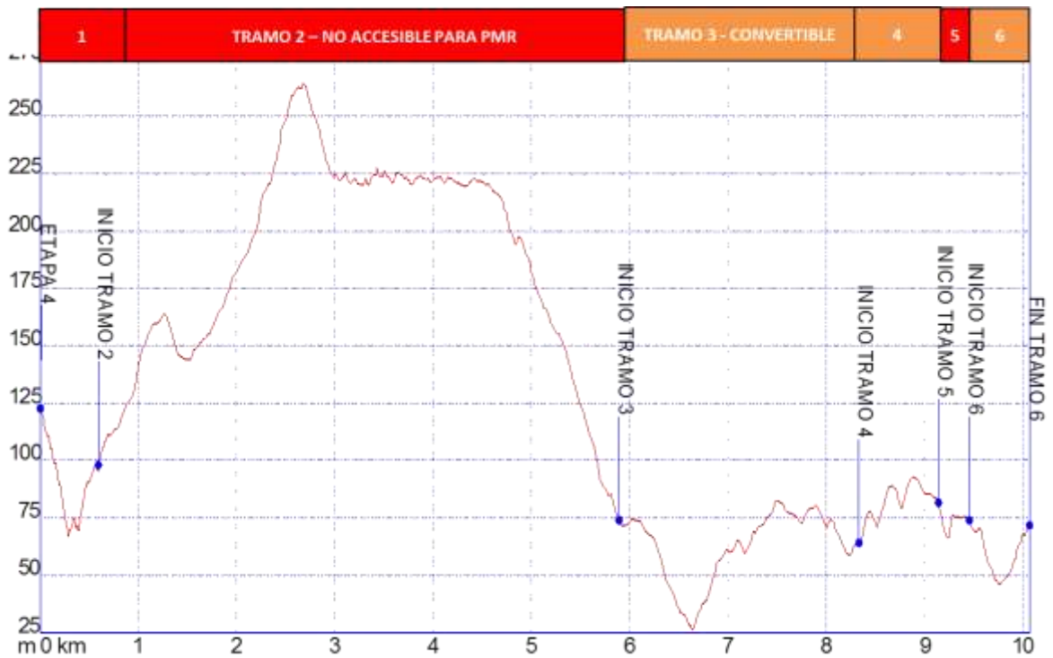
Gráfica 1: Identificación tramos etapa4, nivel de accesibilidad.

➤ PERFIL ETAPA4: Perfil de altitud e identificación por tramos.